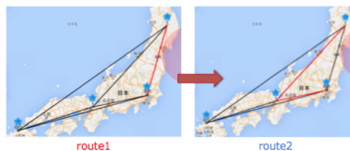
図 3: 経路可視化 web サイト

図 1 の提案システム中に示す、可視化の出力結果を図 3 に示す。(3) より出力された最適経路のリストを基に Google Map 上に可視化を行う。route1 から route2 への経路切替が GUI で確認できる。