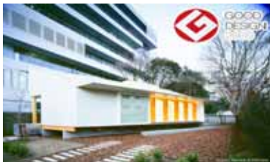
図 2: Ocha House

お茶の水女子大学ユビキタスコンピューティング実験住宅（通称 Ocha House）は、人間の生活に身近な住居において、人間と情報環境が調和的に相互作用を行うための基盤技術の開発を目的として建てられた [4]。外観を図 2 に示す。建物内には台所、トイレ、お風呂、寝室があり、通常の生活が送れるようになっている。建物内にセンサを設置し、人の居る場所を把握する実験や、高齢者の介護に活かせる研究なども行われている。2009 年度グッドデザイン賞を受賞した。